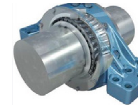
Palier de rotor