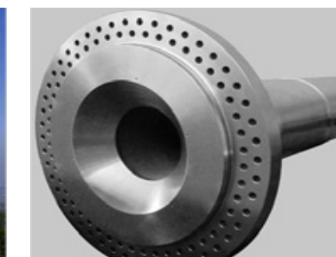
Boîte de vitesses