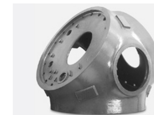
Moyeu de rotor