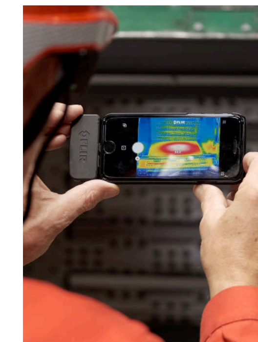
Visualisierung von Hot Spots