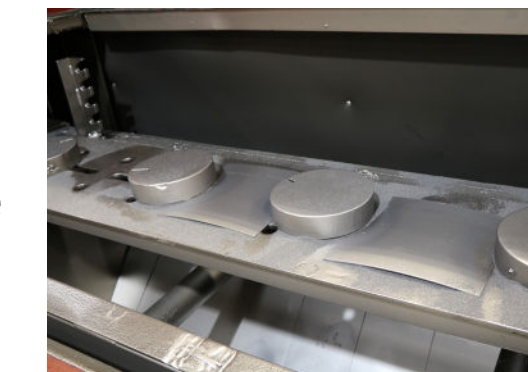
Versuche in unserem Technikzentrum