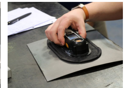
Bewertung der Reinheit