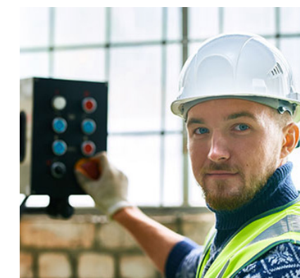
Wartung und Reparaturen